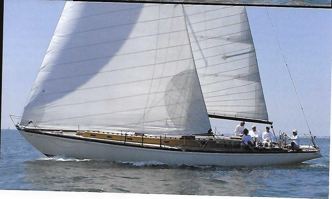
In these photos, different parts of the regatta